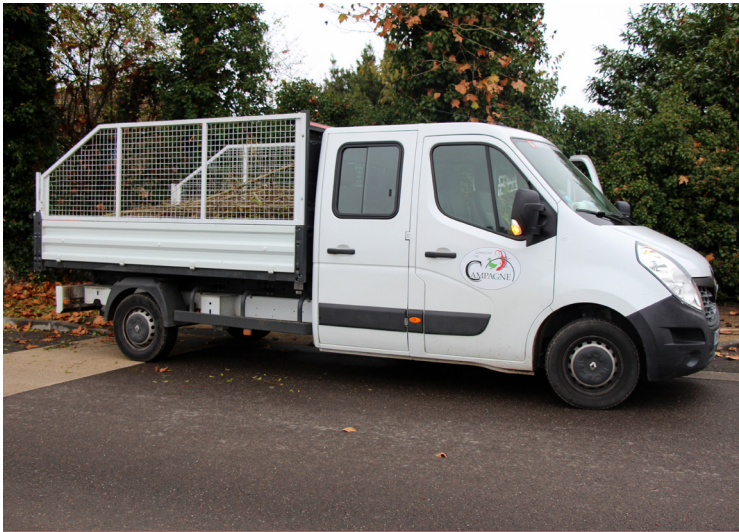
Acquisition d'un camion pour l'équipe technique