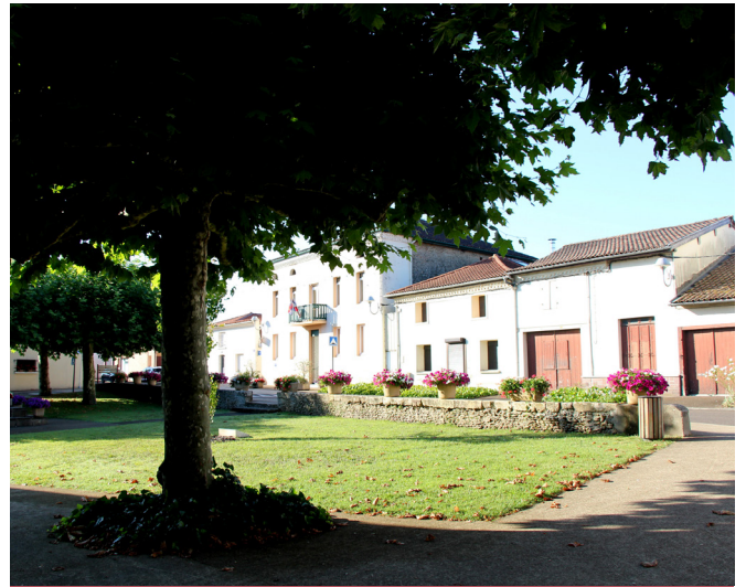
Fleurissement du bourg